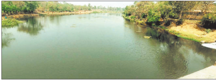
अहिरन नदी में प्रवाहित होता दूषित जल।