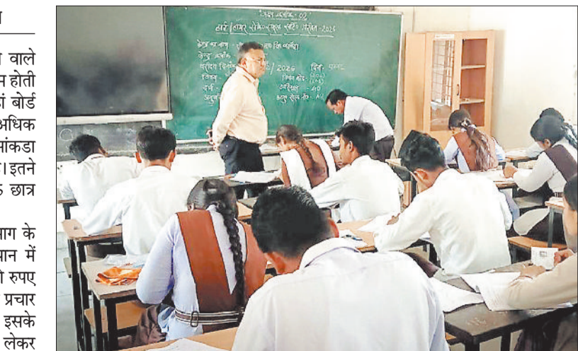
परीक्षा केन्द्र का निरीक्षण करते अधिकारी।

गौरतलब है कि स्कूल शिक्षा विभाग के द्वारा छात्रों के पढ़ाई लिखाई को ध्यान में रखकर हर साल बड़े पैमाने पर करोड़ों रुपए खर्च करके बड़े जोर एवं शोर के साथ प्रचार प्रसार भी किया जाता है। बावजूद इसके जिम्मेदार अधिकारी बोर्ड परीक्षा को लेकर छात्रों को जागरूक नहीं कर पा रहे हैं। स्थिति यह है कि स्थानीय परीक्षा तो दूर की बात बोर्ड परीक्षा दिलाने को लेकर छात्र ध्यान तक नहीं दे रहे हैं। तीन सालों के आंकड़ों पर ही गौर करें