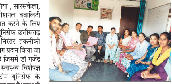
प्रशिक्षण में उपस्थित स्वास्थ्य विभाग की टीम।

तकनीकी मार्गदर्शन में प्रशिक्षण दिया जा रहा है। साथ ही विकासखंड के आर एम ए, समस्त सामुदायिक स्वास्थ्य अधिकारी, आर एच ओ (महिला/पुरुष) इस प्रशिक्षण में सम्मिलित हो रहे हैं। इन आयुष्मान आरोग्य मंदिरों में गुणवत्तापूर्ण स्वास्थ्य सेवाएं सुनिश्चित करने के उद्देश्य से राष्ट्रीय गुणवत्ता प्रमाणीकरण मानकों के अनुसार सुधार किए जा रहे हैं। यूनिसेफ के तकनीकी मार्गदर्शन से स्वास्थ्य सेवाओं की गुणवत्ता को बेहतर बनाने तथा आम नागरिकों को बेहतर प्राथमिक स्वास्थ्य सुविधाएं उपलब्ध