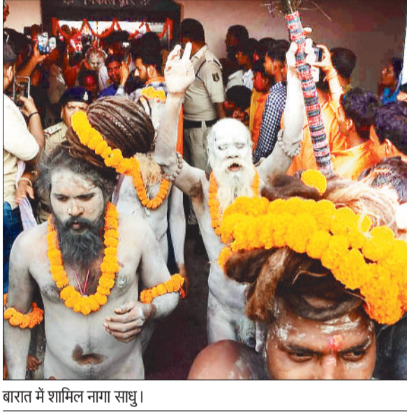
बारात में शामिल नागा साधु।

नागा साधु बाबा कलेश्वरनाथ की बारात में शामिल हुए। इसके साथ पौथमपुर सहित आसपास के गांवों के लोग भी बारात में पहुंचकर इसके गवाह बने। नगर भ्रमण के बाद बाबा कलेश्वरनाथ की प्रतिमा को हसदेव नदी के तट पर ले जाया गया, जहां विधि-विधान के साथ प्रतिमा का स्नान कराया गया और उसके बाद भव्य महाआरती की गई। मेले में उखरा, सौंदर्य प्रसाधन, मनहारी दुकान, शादी विवाह सामग्री, पंखा, लोहे के घरेलू सामान, बर्तन व कपड़ा दुकान के साथ झूला आदि लोगों के मनोरंजन का साधन बना हुआ है। रंग पंचमी के अवसर पर पौथमपुर में निकलने वाली शिव बारात के महेनजर पुलिस की चाक-चौबंद व्यवस्था की गई थी।