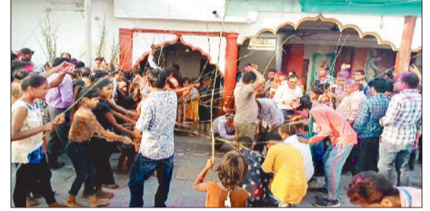
लोगों पर छड़ी बरसाती कन्याएं।

बलौदा ब्लॉक के ग्राम पंतोरा में लठमार होली खेलने की परंपरा सालों से चली आ रही है। फर्क सिर्फ इतना है कि यहां की लठमार होली होली त्योंहार के पांचवें दिन धूलपंचमी के दिन खेली जाती है। इसी मान्यता अनुसार रविवार 8 मार्च को पंतोरा में लठमार होली की धूम रही। इसे ग्रामीण बोल-चाल की भाषा में डंगाली होली कहते हैं। पंचमी की अलसुबह ग्रामीण कोरबा जिले के मड़वारा की जंगल गए, जहां से बांस की छड़ियां लाई गईं। बताया जाता है कि टांगी से एक ही बार में कटने वाली छड़ी को लाया जाता है। वे छड़ियां लेकर सीधे मंदिर पहुंचे जहां दोपहर बाद लोगों की भीड़ लगनी शुरू हो गई। खास कर गांव की 15 साल तक की कुंवारी कन्याएं