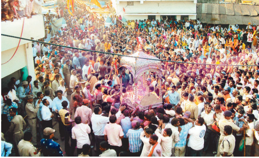
कलेश्वरनाथ की बारात में उमड़ा जनसैलाब।

जिला मुख्यालय से लगभग 13 किमी की दूरी पर पौथमपुर स्थित बाबा कलेश्वरनाथ का प्रसिद्ध मंदिर है, जो हसदेव नदी के पावन तट पर स्थित है। रविवार 8 मार्च को नागा साधुओं की अगुवाई में बाबा कलेश्वरनाथ की भव्य बारात चांदी की पालकी में सवार होकर निकली तो बाराती बनने के लिए लोगों का हजूम उमड़ पड़ा। इसके अलावा हसदेव नदी के तट पर बसे पौथमपुर में 15 दिवसीय भव्य मेला का शुभारंभ धूलपंचमी के साथ शुरू हो गया। यह परंपरा सवा सौ साल से अधिक पुरानी है। चांदी की पालकी में विराजमान भगवान कलेश्वरनाथ की प्रतिमा को पालकी निकालने के पूर्व विधिवत रूप से श्रृंगार किया गया। इसके बाद नागा साधुओं की उपस्थिति में बाबा कलेश्वरनाथ की बारात निकली गई। बारात में बिखरे बाल, नागा साधुओं की उपस्थिति, हाथ में त्रिशूल तथा चिमटा लिए