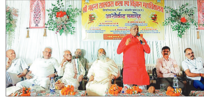
कार्यक्रम में उपस्थित छात्र-छात्राओं को संबोधित करते अतिथि।