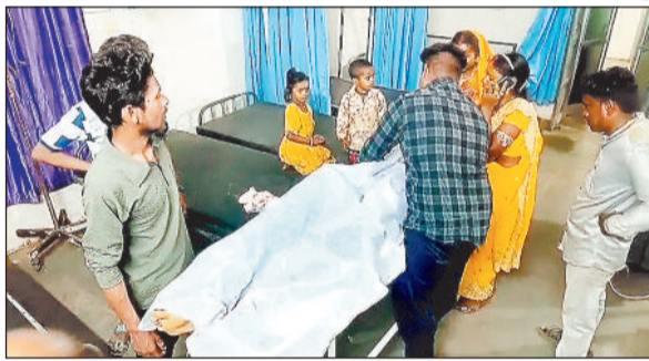
शव के पास विलाप करते परिजन।